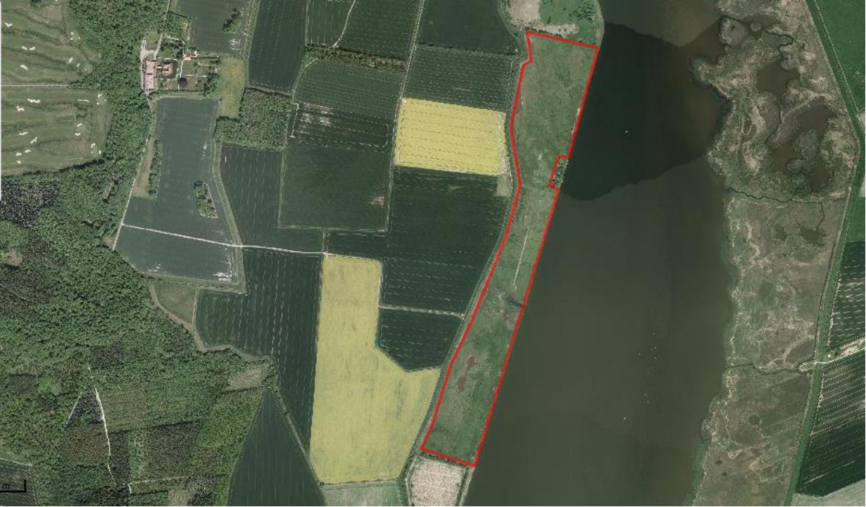
Kastbjerg Ådal 1