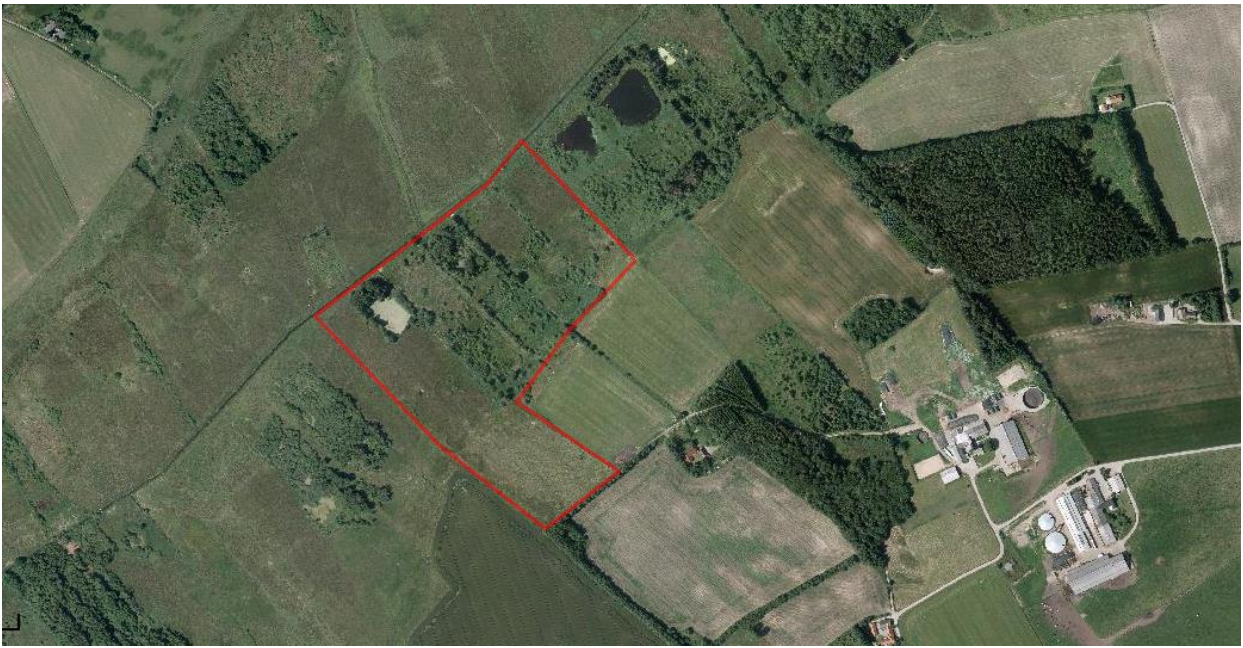
Kastbjerg Ådal 3