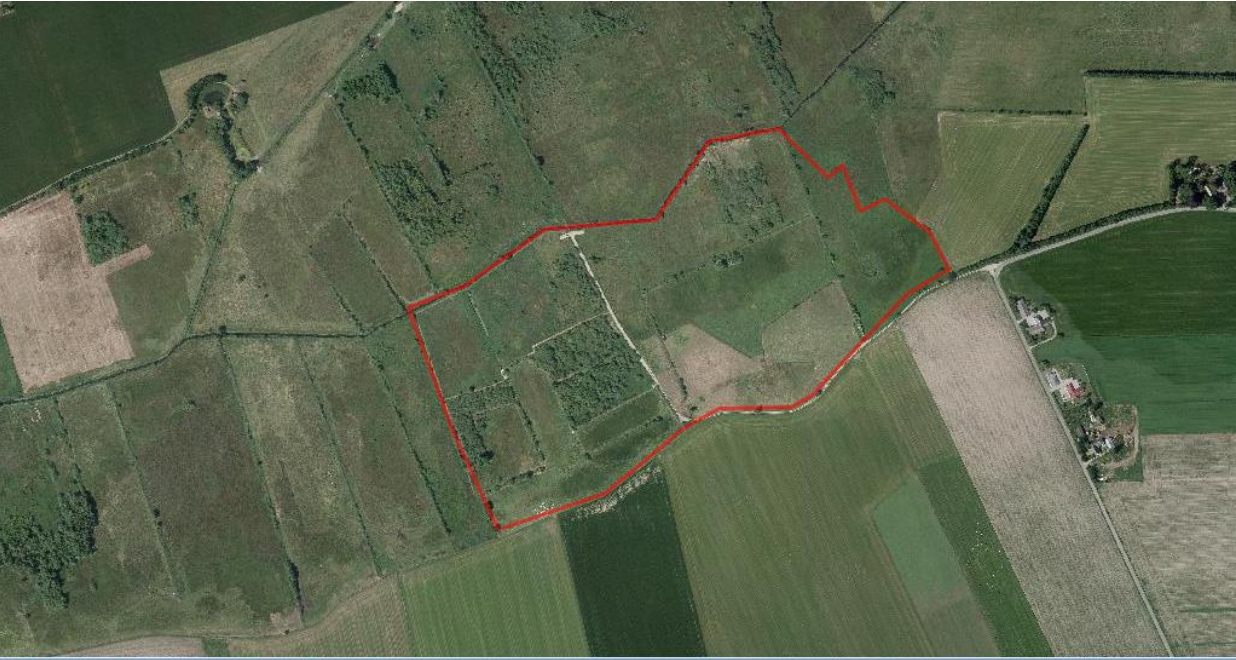
Kastbjerg Ådal 2